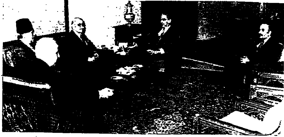
الرئيس سركيس يستقبل الرئيس سلام والمصلح والسيد حسن الحسيني ومحمد صني الدين

شغل المتكلم جلسة مجلس الوزراء صباح امس اجتمع بين الرئيس اليماني تركيش والسفير الاميركي في لبنان السيد ريتشارد باركر ، عرضا خلاله المعلومات المتوفرة من آخر تطورات الوضع في الجنوب والبلد . وقد انضم الرئيس سليم الحص الى الاجتماع الذي بدأ في التاسعة صباحا واستمر حوالي ساعة . وفي العاشرة والتفصلا تم عقد مجلس الوزراء في غياب الوزيرين نواف بطرس والكور احمد زكي وكلاهما في مهمة رسمية . الحص : لا تعليق في الثانية والربع انتهت الجلسة ، ورد الرئيس الحص على الاسئلة التي وجهت اليه بقتاب كلسي ويلوحه التي : ● ما رأيك بالدعوة التي وجهها بيغن للرئيس الجمهوري زيارة اسرائيل ؟ ● ما عندنا تعليق ؟ ● هل بلغت الدعوة مجلس الوزراء ؟ ● لم يبلغ مجلس الوزراء بذلك . ● هل اباح باركر للرئيس تركيش هذه الدعوة ؟ ما عندنا حتى . تصريح شعيتو اما الوزير الدكتور ابراهيم شعيتو فقال : اطمنا خلال الجلسة على نتائج الاتصالات بالنسبة للجنوب والمسامي جارية ، والرئيس بصالحه الدبلوماسية والعمرية ، تمكن من ان يوقف التصعيد الذي حصل في الجنوب خلال الايام الماضية وتامل خيرا . وان الايام المقبلة يمكن ان تحمل الحل للجنوب . وبالتالي نسي هذا الحل الظروف مؤاتية لان اكثر من السابق ، ونفي الاطراف التي كانت تضع تعض للشرط أصبحت الان تتساهل اكثر . ● ما هي الشروط الموضوعه للتفويض ؟ ● اسالوا رئيس الجمهورية ، فهو مهم بالوضع كثيرا ، والاتصالات تتم معه شخصيا مع رئيس الحكومة ، وهذا يتوافق بالنسبة الى هذا الموضوع الكثر . واتا اكثر ما قلته دائما ان اي خطر يهدد الجنوب سيكون له تاثير على كل لبنان ، وحيشال خطرنا على لبنان ككل ، وان يتصر الخطر على الجنوب .